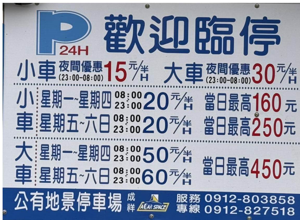
圖三、山形閣旁公有停車場收費標準

飯店因腹地限制， 未提供免費停車服務 ；飯店旁有公有收費停車場（如圖一、二黃色區塊標示；收費標準如圖三）。